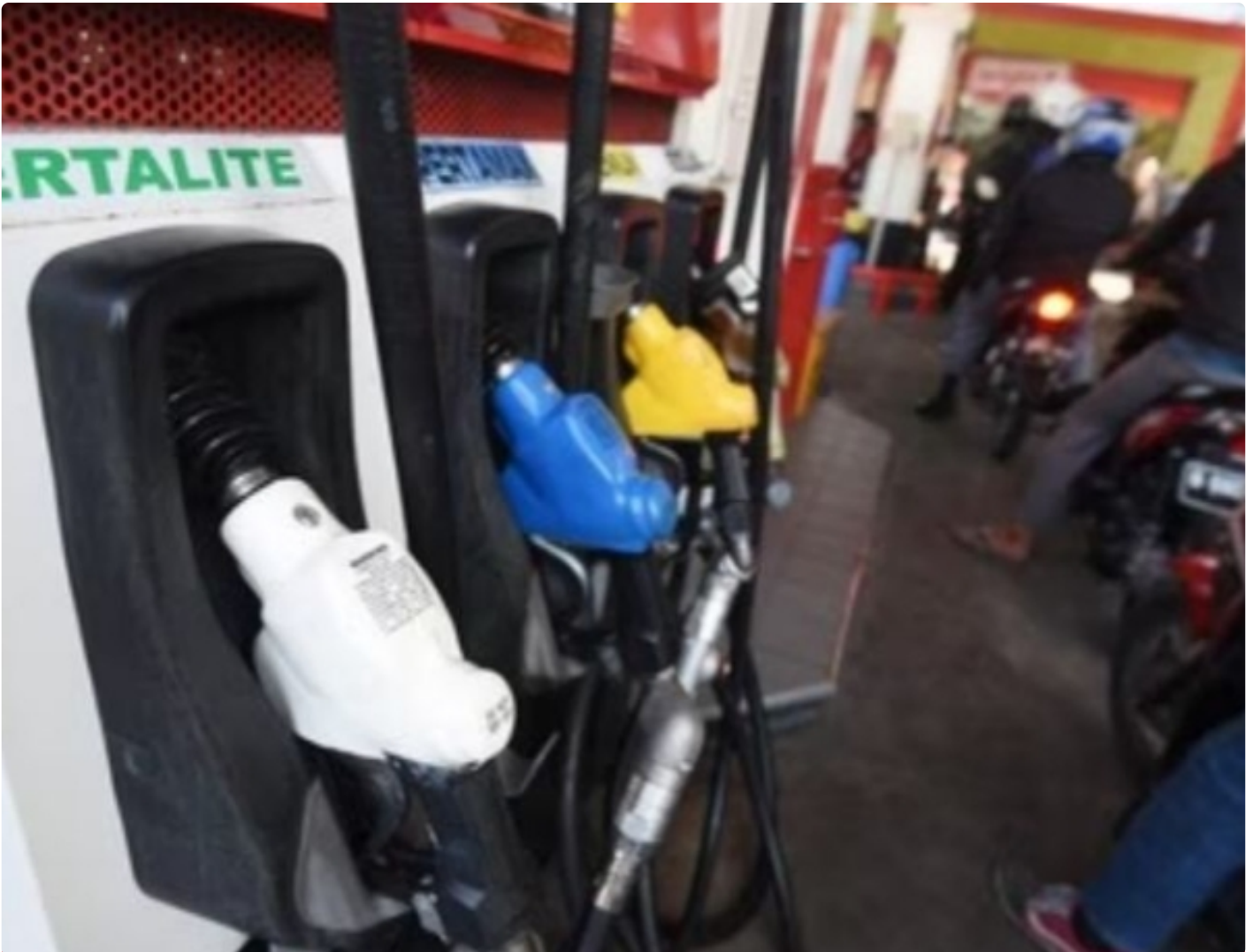
Gambar Ilustrasi di Sebuah SPBU

PALANGKA RAYA - Pemerintah Republik Indonesia telah resmi mensahkan Peraturan Pemerintah Pengganti Undang - Undang Republik Indonesia No 2 Tahun 2022 Tentang Cipta Karya.